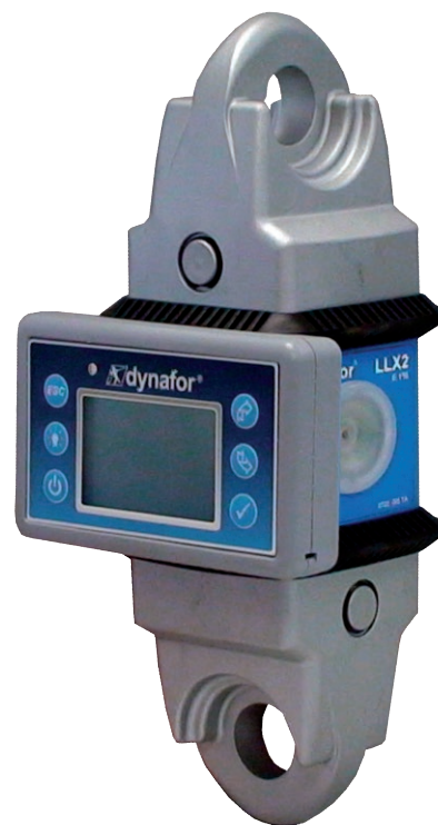
dynafor™ LLX2 0,5t

Elektronisches Zugkraftmessgerät mit abnehmbarem und vernetzbarem Bedienteil und USB-port. Der dynafor™ LLX2 / LLXh ist ein Meilenstein in der Zugkraftmessung: Das Bedienteil kann am Messgerät angedockt oder abgenommen werden, um es als Fernablesegerät einzusetzen. Die einzelnen Messgeräte können miteinander vernetzt werden, sodaß z.B. drei Messwerte von drei Messgeräten auf einem Bedienteil angezeigt werden können. Die patentierten Anschlagösen der dynafor™ LLX2 erlauben die Verbindung sowohl mit handelsüblichen Schäkeln als auch mit allen genormten Kettenanschlagmitteln. Der dynafor™ LLX2 ist auch mit parallelen Anschlagösen (koplanar) lieferbar. Der dynafor™ LLXh wird mit parallelen Anschlagösen (koplanar) geliefert.